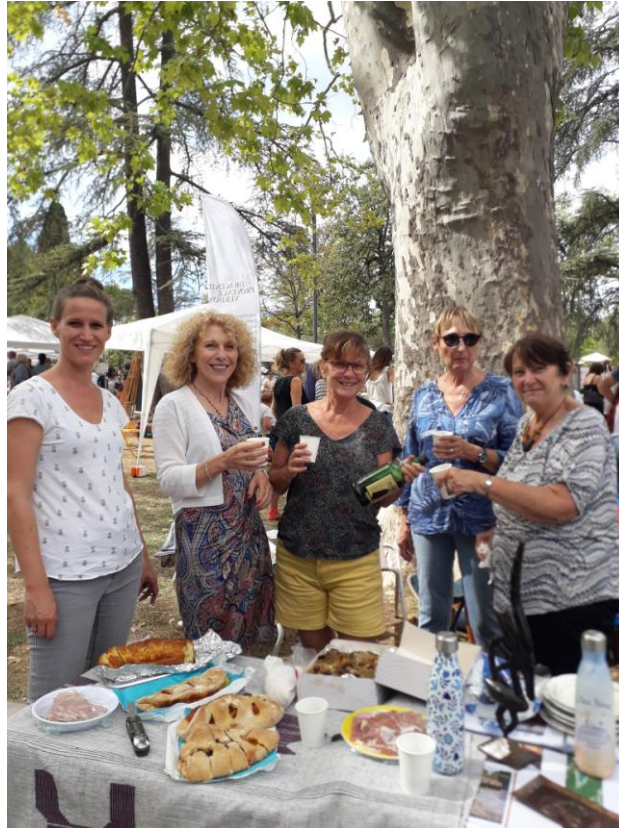
Joie de trinquer à nos retrouvailles et à nos projets