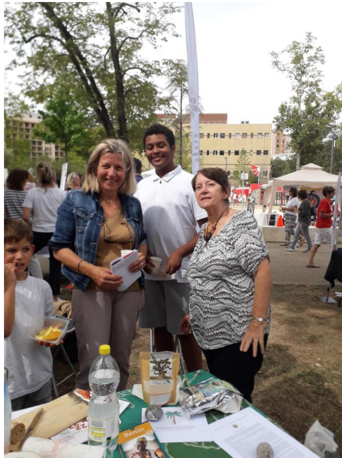
Joie du brassage des générations