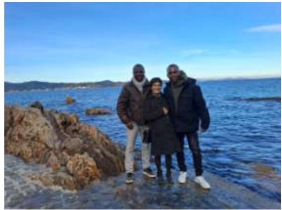
Paisible et insouciant balade à Saint-Tropez