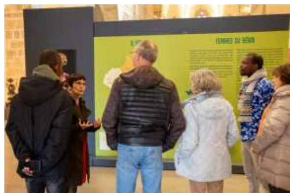
Visite guidée du 16 janvier

Des ateliers animés par Maryvonne Boudier : 27 janvier et 24 février