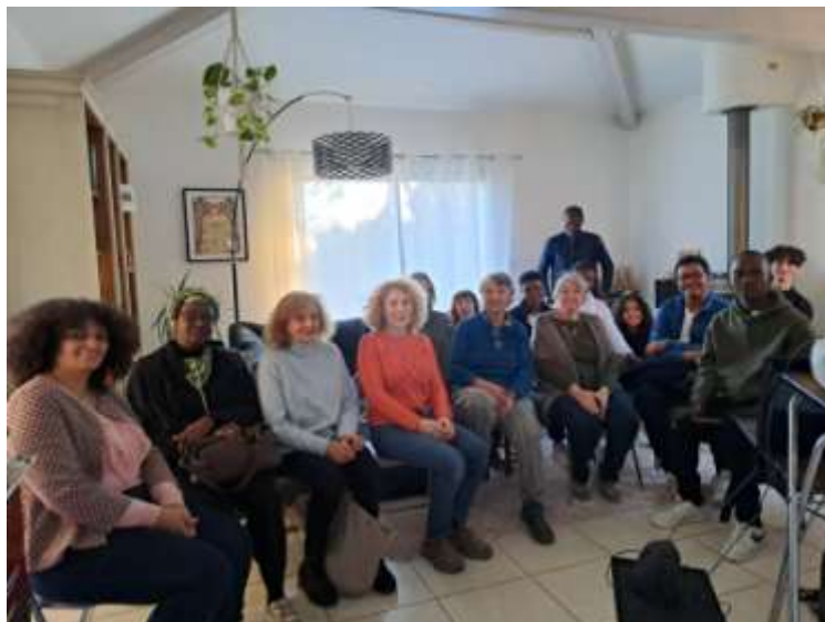
Projection, chez Catherine Lebout, du film L'ARGILE , réalisé par Arcade Assogba