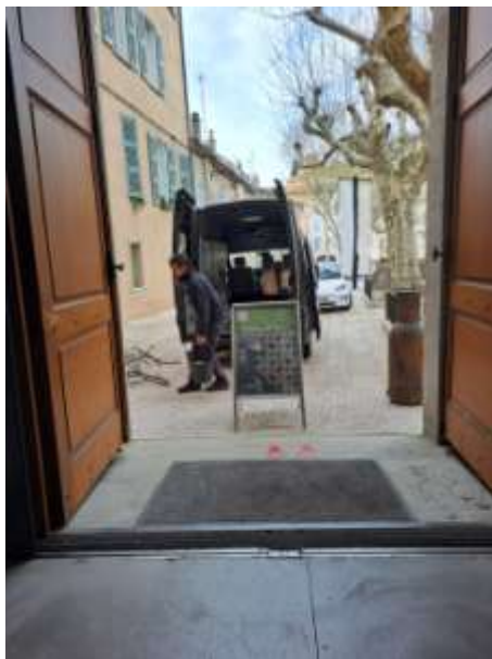
Christophe, apiculteur a mis son fourgon à disposition de MANIOC