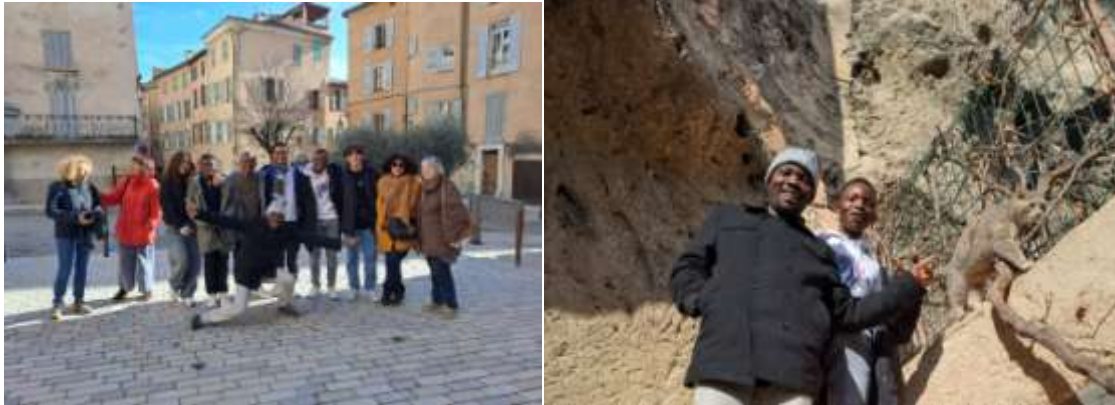
Sortie à Cotignac