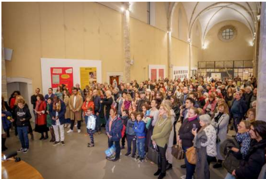
Un public nombreux

Le point presse et le vernissage