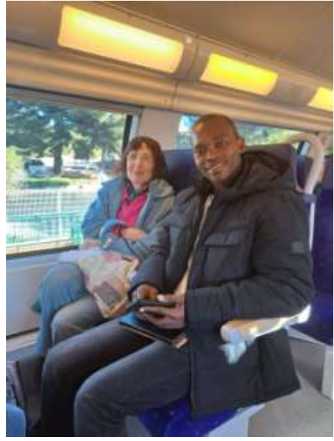
Départ pour le Mucem pour voir l'exposition Une autre histoire du monde