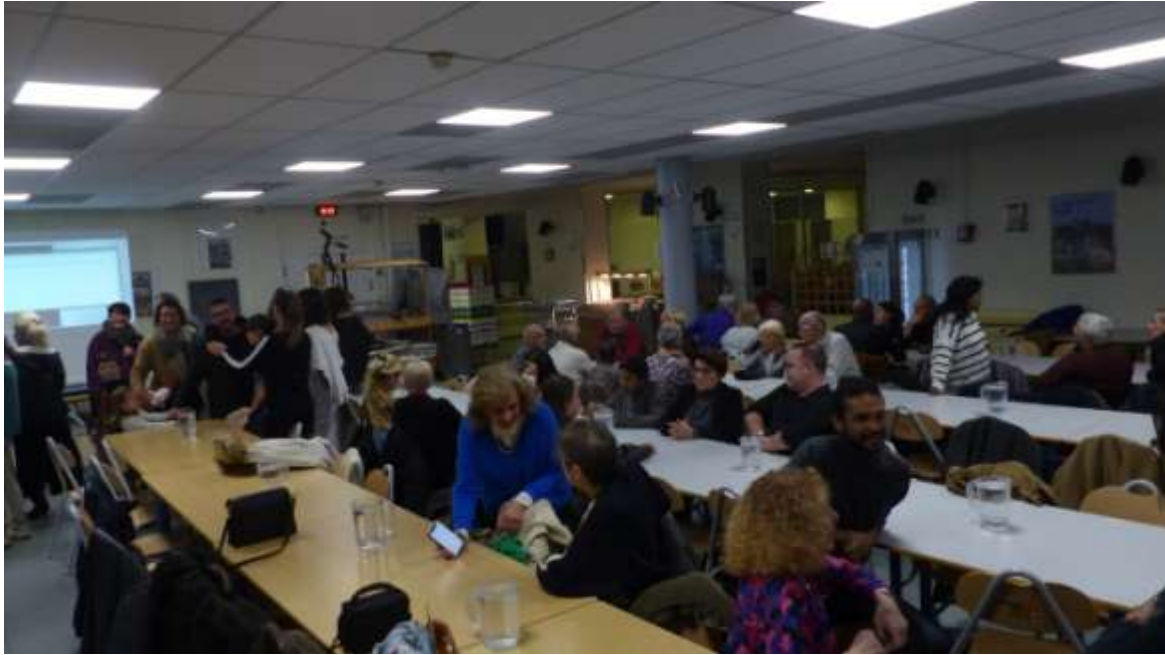
Les participants à la fête commencent à s'installer...