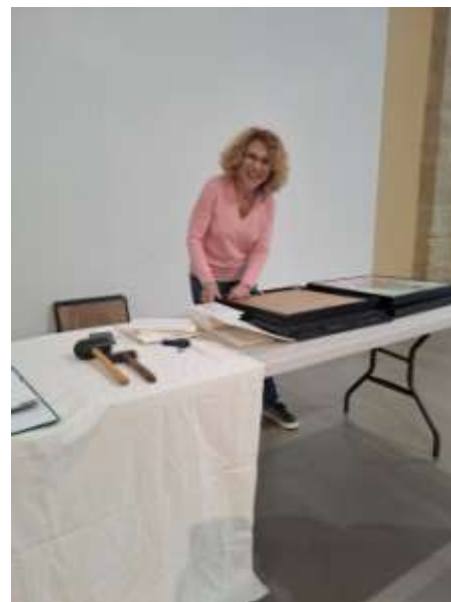
Catherine défait les portraits de femmes